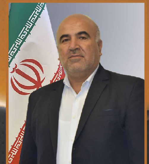
مهندس جوان صنایع عمومی