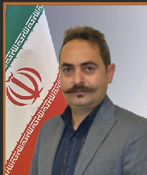
مهندس علمداری بازرگانی