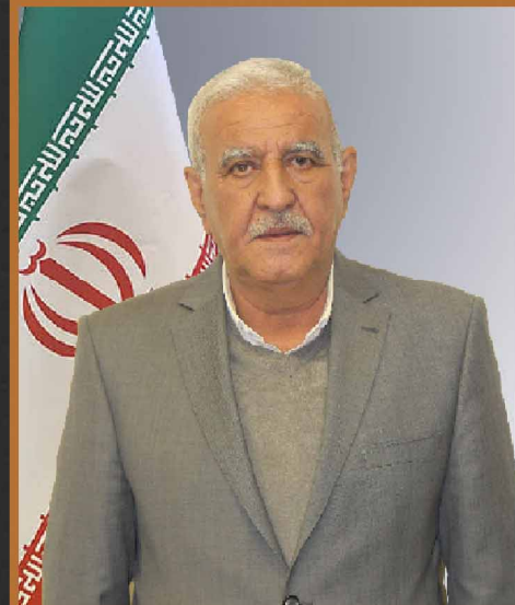
آقای روستایی صنایع کشاورزی