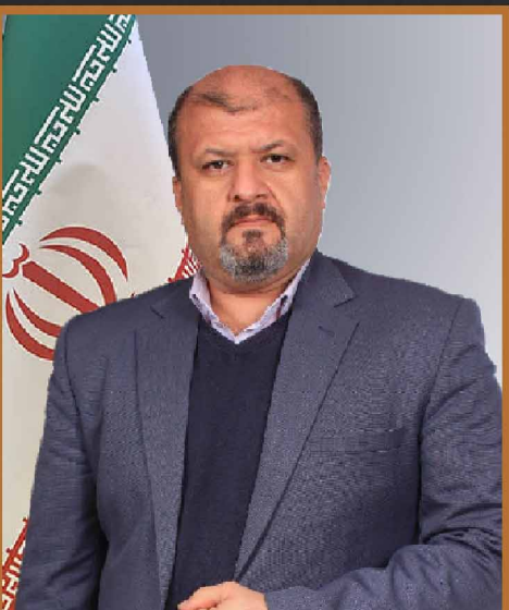
مهندس برزگر بازرگانی