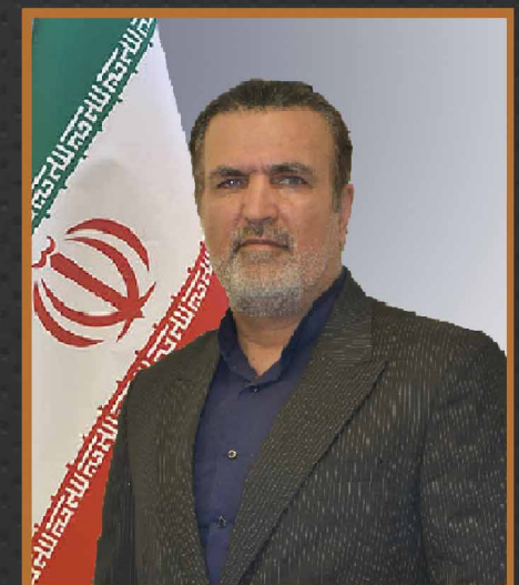
دکتر محسن نظرپور معاون مسکن و شهر سازی