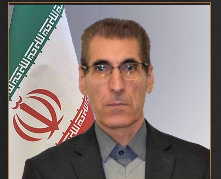
استاد محمد محمدی سهروردی