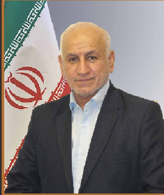
دکتر حاجی علی نژاد امور دولت