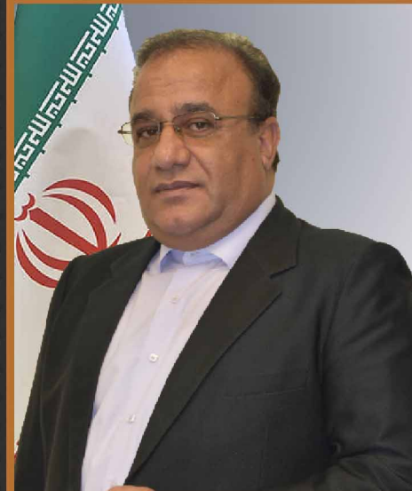
مهندس منیری صنایع عمومی